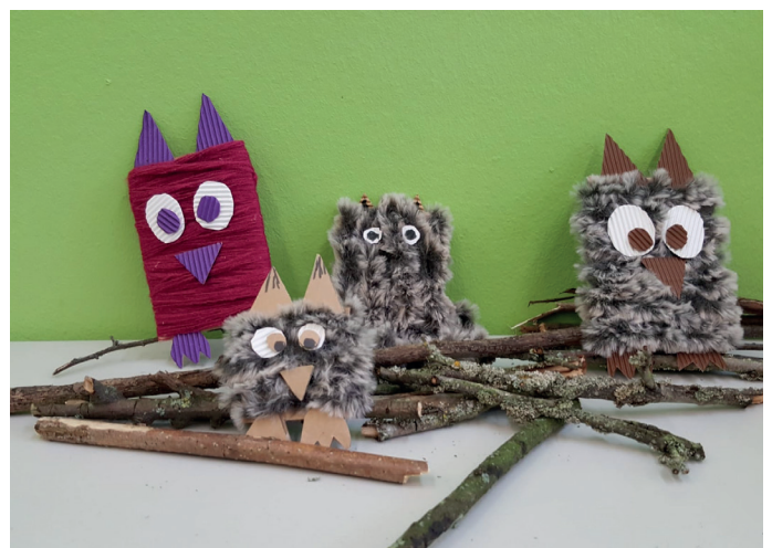
Aus Toilettenpapierrolle haben wir kleine Vogelscheuchen und aus Papier und Wolle kleine Eulen gezaubert.