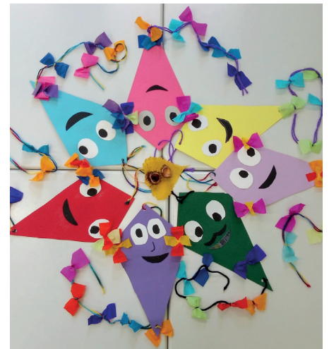
Herbstdeko für die MIBE-Fenster: Wir haben gemeinsam bunte Papierdrachen und Herbstblätter aus gefärbtem Küchenkrepp gestaltet.