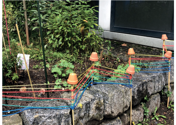
Mal sehen, wie unser Beete im Frühjahr aussehen werden!