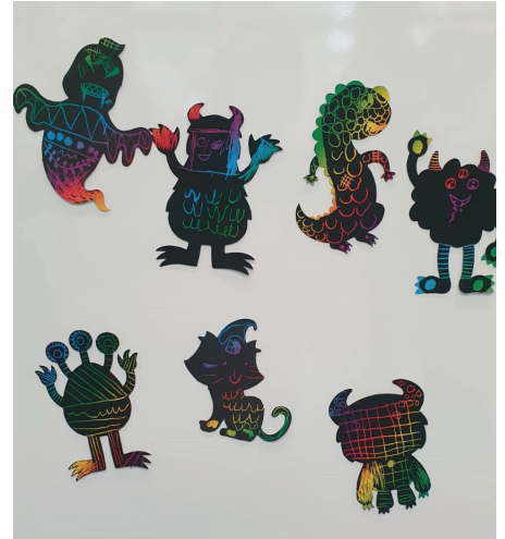
Zu Halloween haben wir kleine, bunte Kühlschrankschrankmagneten-Monster ausgekratzt.