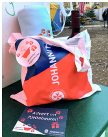
Kleine Helfer gegen Kälte.