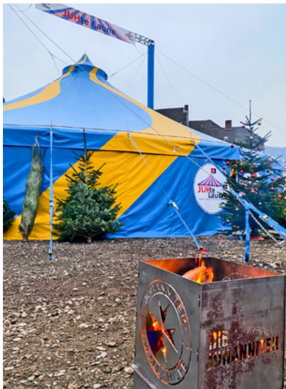
Das JUHte-Laune-Zirkuszelt in Dernau – ein wichtiger Treffpunkt für die Menschen.

Das Engagement der Johanniter, die seit dem ersten Tag der Katastrophe im Einsatz sind, ist auf Dauer ausgelegt. Nach der Akuthilfe sowie kurz- und mittelfristigen Unterstützungsleistungen liegt der Fokus nun verstärkt darauf, nachhaltige Strukturen für den Wiederaufbau des Ahrtals zu schaffen. Dazu gehört neben der Antragsberatung, der Handwerkervermittlung und dem Handwerkerdorf unter anderem auch der Ausbau der Freizeitangebote im JUHte-Laune-Zirkuszelt. Hier finden ein offener Kinder- und Jugendtreff und kostenlose Ferienbetreuung statt, aber auch zahlreiche weitere Veranstaltungen, etwa Kinoabende für Familien, Spieleabende und Tanzveranstaltungen für Senioren, Adventsnachmittage mit geselligem Beisammensein oder, ganz aktuell, Infoveranstaltungen rund um das Thema Energie.