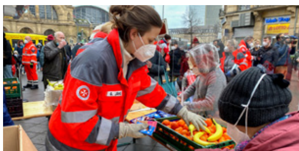
Helfer bei der Suppenküche.

Doch allein aus Mitteln der Hilfsorganisation lassen sich die Aktionen leider nicht bestreiten. Daher bitten die Johanniter um Kleidungs- und Geldspenden. Gesucht werden ausschließlich warme Kleidung wie Pullover, Jacken, Socken, Mützen sowie Schlafsäcke und warme Decken. Diese Spenden können bei den Johannitern in Frankfurt/Nieder-Eschbach, Berner Str. 103 – 105, 60437 Frankfurt oder nach telefonischer Absprache in einer unserer Einrichtungen abgegeben werden.