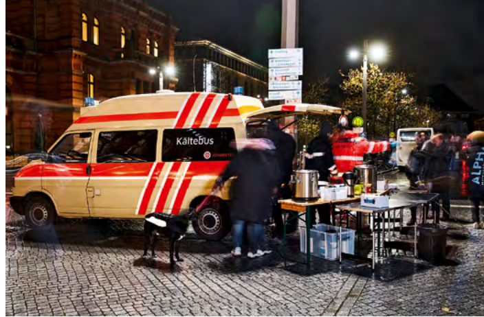
Neben Bremen sind die Johanniter des Landesverbandes Niedersachsen/Bremen auch in Hannover und in Oldenburg mit dem Kältebus vertreten.

Wie bedeutend ihr Einsatz ist, spüren die Ehrenamtlichen immer wieder aufs Neue: „Danke, dass ihr da seid!“ oder „Kommt ihr