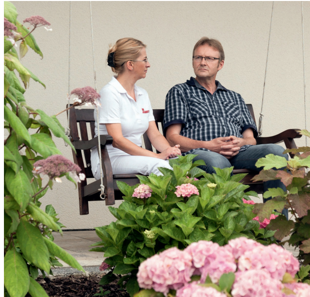
Wir haben Zeit auch für schwierige Fragen.

Hospizarbeit der Johanniter bedeutet: würdig leben bis zuletzt.