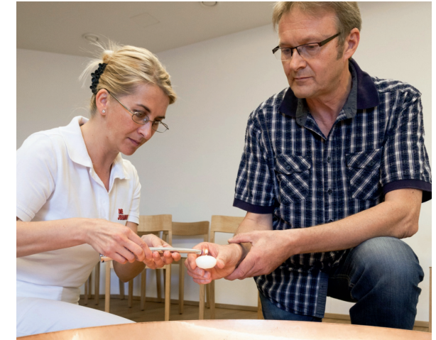
Wir haben Zeit auch für das gemeinsame Schweigen.

Durch regelmäßige Besuche sind die Ehrenamtlichen unseres ambulanten Hospizdienstes auch für die Zugehörigen eine wertvolle Hilfe. Denn auch sie brauchen eine Ansprechperson in dieser Zeit. Die Entlastung durch unseren Dienst ermöglicht ihnen, sich um sich selbst und um wichtige Angelegenheiten kümmern zu können.