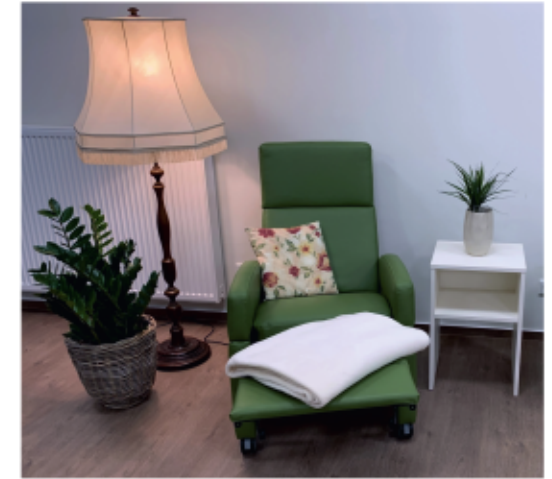
Ruhe und Entspannung sind zu jeder Zeit möglich

Unsere Gäste haben die Möglichkeit, auf Wunsch gemeinsam alle Mahlzeiten im geräumigen Aufenthaltsraum mit offener Küche zu genießen.