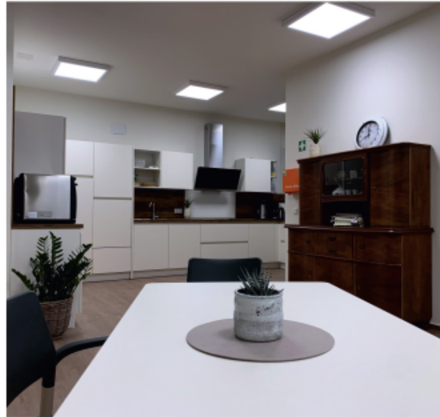
Offenes Wohnraum- und Küchenkonzept

Unser Haus ist mit einem großzügigen Gemeinschaftsraum mit integrierter offener Küche und Ruheräumen ausgestattet. Bei schönem Wetter lädt unser Sinnesgarten zu gemeinschaftlichen Aktivitäten ein.