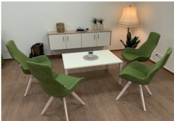
Gemeinsam statt einsam

Wir übernehmen auch in Ihrem Zuhause die pflegerische Versorgung im Rahmen der Pflegeversicherung sowie die ärztlich verordnete Behandlungspflege wie Anziehen von Kompressionsstrümpfen und Richten von Medikamenten. Ebenso gehören Hilfen im Haushalt, beim Einkaufen und individuelle Betreuungsleistungen dazu. Unser Team verfügt über fachliche Qualifikation und hohe soziale Kompetenz.