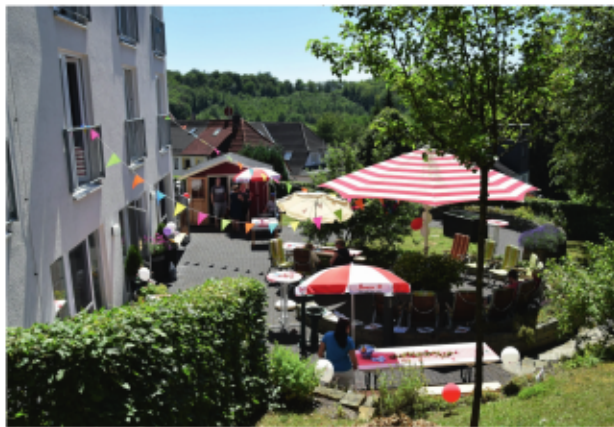
Unser Außengelände wird gerne genutzt

Wir übernehmen auch in Ihrem Zuhause die pflegerische Versorgung im Rahmen der Pflegeversicherung sowie die ärztlich verordnete Behandlungspflege wie Anziehen von Kompressionsstrümpfen und Richten von Medikamenten. Ebenso gehören Hilfen im Haushalt, beim Einkaufen und individuelle Betreuungsleistungen dazu. Unser Team verfügt über fachliche Qualifikation und hohe soziale Kompetenz.