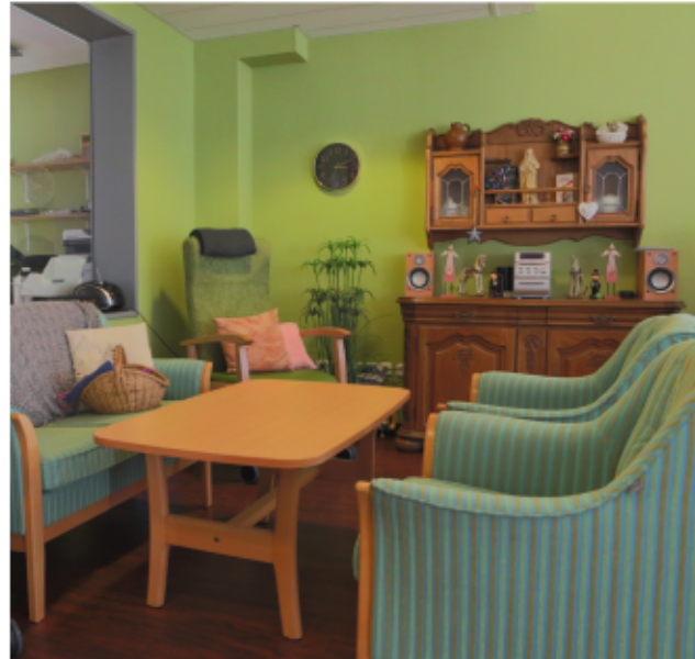
Wir bieten ein offenes Wohnraumkonzept in hellen Räumen

Unser Haus ist mit einem großzügigen Gemeinschaftsraum mit integrierter offener Küche und Ruheräumen ausgestattet. Bei schönem Wetter lädt unser großes Außengelände zu gemeinschaftlichen Aktivitäten ein.