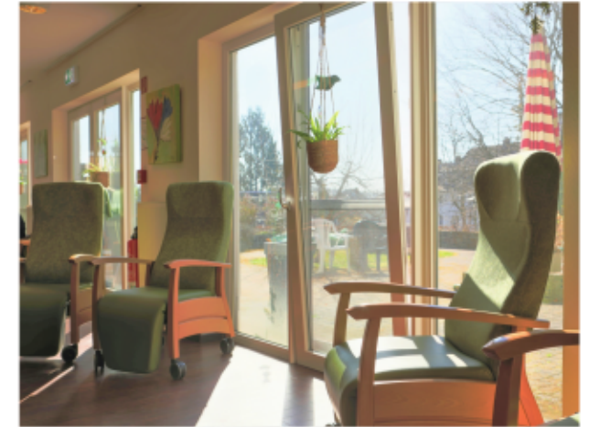
Ruhe und Entspannung sind zu jeder Zeit möglich

Unsere Gäste haben die Möglichkeit, auf Wunsch gemeinsam alle Mahlzeiten im geräumigen Aufenthaltsraum mit offener Küche zu genießen.