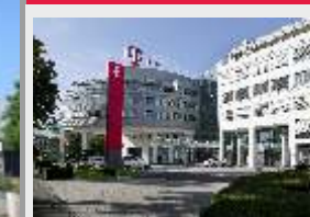
Veranstaltungsort Deutsche Telekom AG