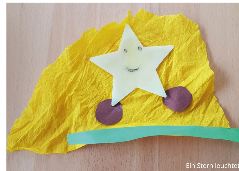
Ein Stern leuchtet

Das macht sie dann mir zuliebe. Sie motiviert mich, das Lied auf Arabisch zu lernen.