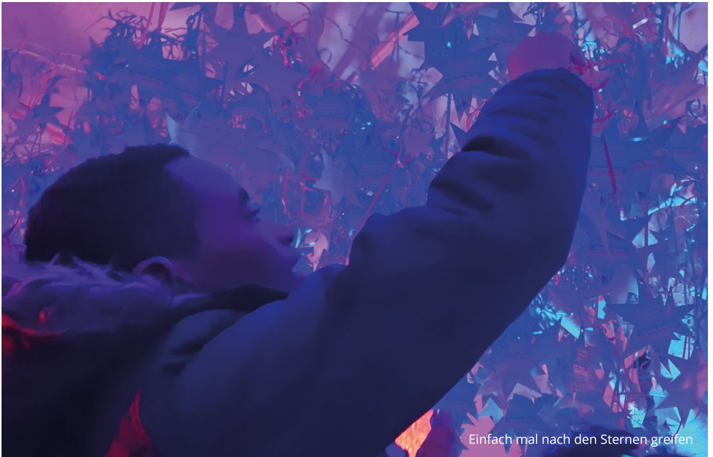
Einfach mal nach den Sternen greifen