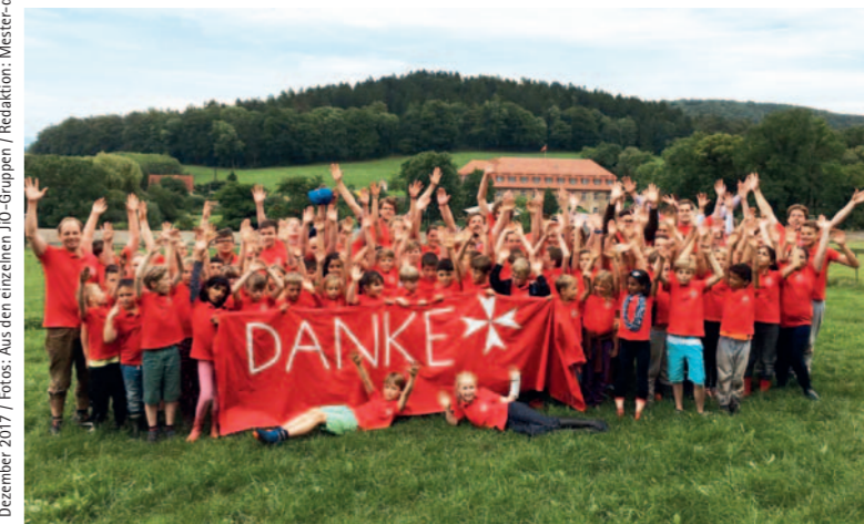
Dezember 2017 / Redaktion: Meister-de-Parajid / Angaben freibleibend / Änderungen möglich