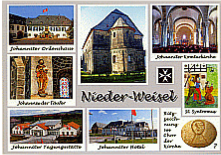
A11 Nieder-Weisel heute