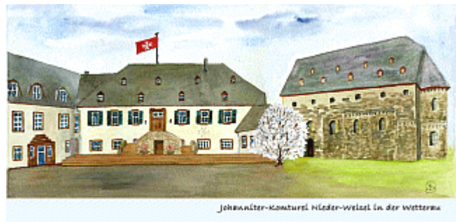
A15 Johanniter-Komturei Nieder-Weisel in der Wetterau