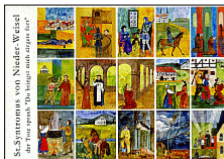
St. Syntromus von Nieder-Weisel der Fürst sprach "Du bringst mich etwas fort"

Aus der Kirchenchronik Nieder-Weisel (1858) Von St. Syntromus Leben und Todt beschrieben. 1. Syntromus bittet Gott in Kreuzlage vor der Pforte um Entlassung aus der weltlichen Gesellschaft. 2. Syntromus bittet seinen Dienstherren um Urlaub. 3. Sein Vater lehnt Wunsch Mönch zu werden ab. 4. Ritter Syntromus reitet zum Kloster Corben. 5. Syntromus wird als Mönch aufgenommen. 6. Er pilgert zum Hlg. Grab nach Jerusalem, trifft am Jordan einen Geillert, der ein Jünger ist des St. Brenden und ihm einen goldenen Stab schenkt. 7. Syntromus zurück und bittet den Abt um Urlaub. 8. Syntromus dankt Gott Beilighlich für seine Gnade. 9. Syntromus nichtigt in Nieder-Weisel und gibt der Wirtin den goldenen Stab in Obhut. 10. Wirt erschlägt Syntromus und behält den Stab. Aber das Blut des Toten wollte nicht stocken. 11. Sie werfen den Toten in heisses Wasser. Aber sein Blut wollte dennoch nicht stocken. 12. Das Pferd verweigert den Toten in der Wetter zu setzen. Der tote Leichnam spricht: „Du bringst mich nirgts fort“. 13. Der Wirt verscharrt den Toten im Pferdestall. 14. Das Land wird mit Unwetter und Missethat bestraft. Der reuige Wirt raset sich zu Tode. 15. St. Syntromus wird mit Gesang und Glockengeläut nach 5 Jahren ehlich bestattet. Bei www.Johanner-Orden-Hessen.de , Kapitel Ordens-Geschichte, ehemalige Johanner-Stätten, finden Sie den Urtext und weitere sehenswerte Einzelheiten. Bilder gemalt von www.Katrin-Ehrlich.de , Tausenstein. Karte erstellt von ER Brun Frhr.v.Berlepsch (2008)