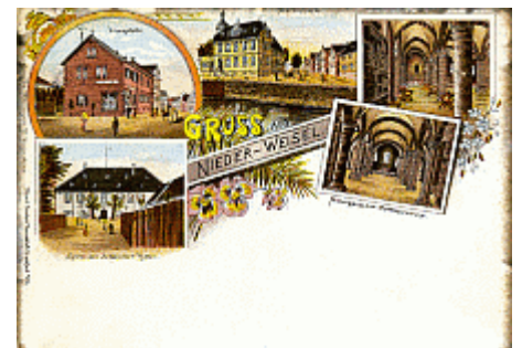
A9 Nieder-Weisel 1897