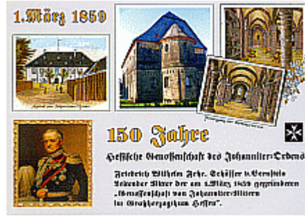
A13 150 Jahre Genossenschaft