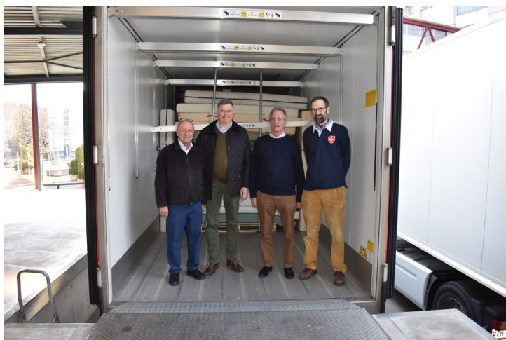
Die oekumenische Verlade-Equipe im Embraport, 1.3.2022.

Der Angriffskrieg Russlands hat Millionen Ukrainerinnen und Ukrainer dazu gezwungen, innerhalb weniger Tage ihre Heimat zu verlassen. Mit zahlreichen Hilfsgüterlieferungen fügt sich unsere Sektion Materialversand ins Ausland in die grosse Gruppe von Hilfeleistenden ein, die das furchtbare Leid und die grosse Verzweiflung dieser Menschen etwas zu lindern versuchen.