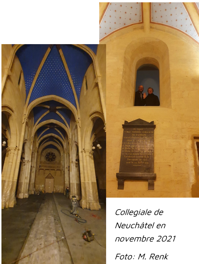
Collegiale de Neuchâtel en novembre 2021