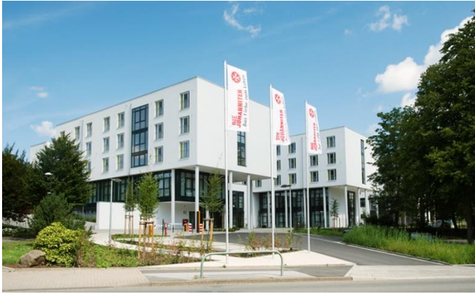
Die Johanniter-Klinik am Rombergpark

Neben der Rehabilitation bietet die Johanniter-Klinik an Rombergpark auch ein umfangreiches therapeutisches Angebot mit Leistungen im klassischen Heilmittelbereich (Leistungen auf Rezept). Alles unter einem Dach, auf Ihr Rezept zugeschnitten und ausgeführt von unseren qualifizierten Therapeutinnen und Therapeuten.