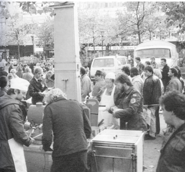
Eine Suppenküche der Johanniter im Jahr 1989.

Gründung des ersten JUH-Kreisverbandes der DDR am 9. März in Wismar. Bis Oktober entstehen 46 neue Standorte.