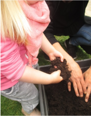
Befüllen der Beete mit Erde.