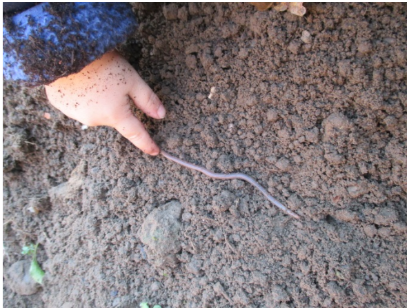
Ein Regenwurm bei den Tomaten.