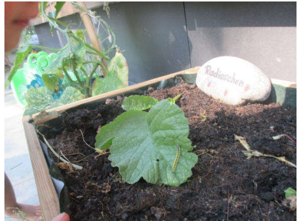
Raupen bei den Radieschen.