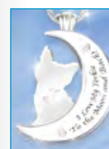
Feine Gravur auf der Rückseite (Abbildung in Originalgröße)

Seit Ihr geliebter Hund als kleiner Welpen zu Ihnen kam, ist er Ihnen ein treuer Gefährte. Von einem Haustier ist er zu einem echten Familienmitglied geworden, das Sie bis zum Mond und wieder zurück lieben. Feiern Sie nun das Band der Liebe, das Sie mit Ihrem Hund verbindet, mit einem speziell auf Ihre Hunderasse maßgeschneiderten Anhänger!