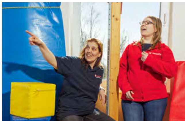
Täglich wechselnde Nachmittagsangebote gehören im „Zauberhut“ dazu. Ebenso wie ein fairer Umgang miteinander.