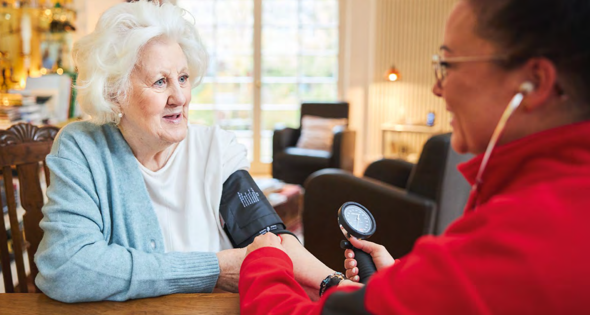
Die Pflegeversicherung finanziert den Einsatz eines Pflegedienstes, zum Beispiel der Johanniter.