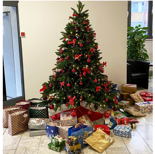
Die Geschenke für die bedürftigen Familien warten hübsch verpackt auf die Übergabe.

Weitere Information zur Johanniter-Suppenküche erhalten Sie bei Monika Gorny unter 069 366 006 602 oder auf www.johanniter.de/suppenküche-frankfurt .