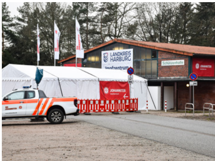
Das Impfzentrum in Buchholz ist seit dem 15. Dezember 2020 einsatzbereit.