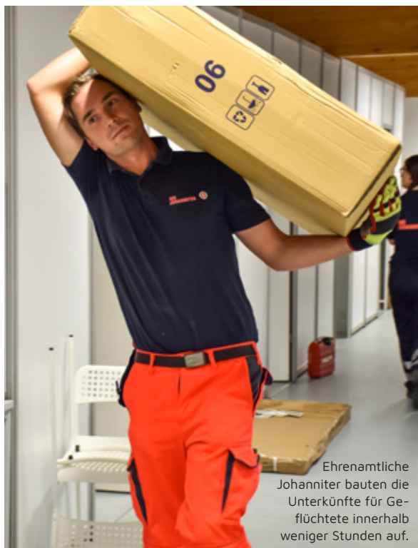
Ehrenamtliche Johanniter bauten die Unterkünfte für Geflüchtete innerhalb weniger Stunden auf.