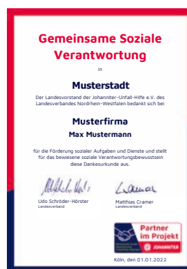
Partner im Projekt Urkunde