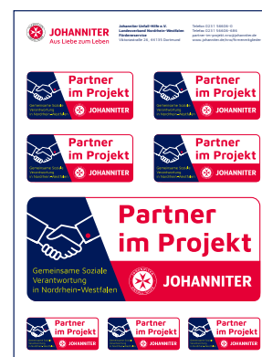
Partner im Projekt Aufkleber