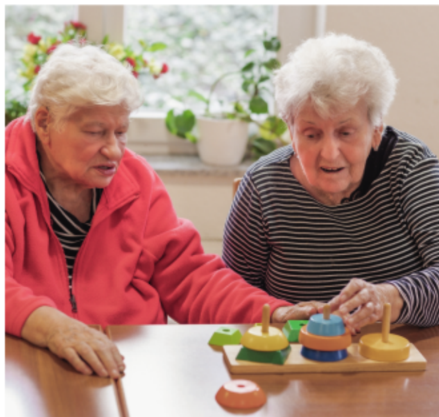
Wer möchte, findet im „Anderland“ viele Kontakte.

Im Alltag fördern und aktivieren unsere Betreuungskräfte die individuellen Fähigkeiten und Ressourcen der Menschen und respektieren dabei ihre Wünsche und ihr Recht auf Selbstbestimmung.