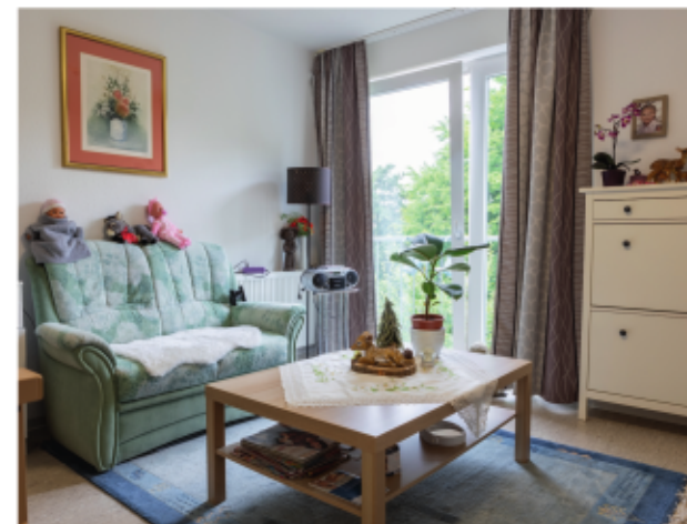
Das Bedürfnis nach Rückzug erfüllt die eigene Wohnung.