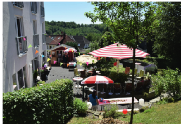
Das „Anderland“ ist eines unserer Angebote in der Region.

Wir übernehmen ebenso in Ihrem Zuhause die pflegerische Versorgung im Rahmen der Pflegeversicherung sowie die ärztlich verordnete Behandlungspflege wie Anziehen von Kompressionsstrümpfen und Richten von Medikamenten. Ebenso gehören Hilfen im Haushalt, beim Einkaufen und individuelle Betreuungsleistungen dazu. Unser Team verfügt über fachliche Qualifikation und hohe soziale Kompetenz.