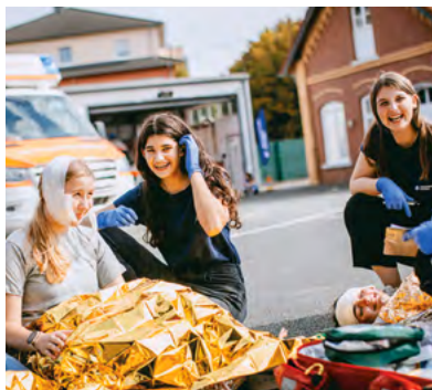
Mitgefühl, Verantwortung, Spaß: Schulsanitäterinnen der Johanniter.