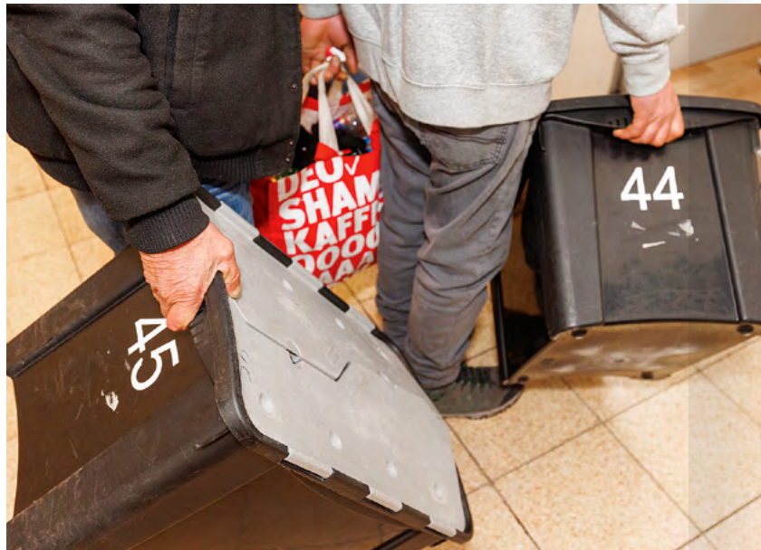
Mitgebrachtes muss in die Box: Für die Gäste der „Ohlauer 365“ gelten klare Regeln.

Nach dem Security-Check erhält jeder Gast eine große schwarze Plastik-Kleiderbox mit der passenden Nummer, um seine Sachen sicher zu verwahren. Denn in den Schlafräumen sind weder Jacken noch Gepäck erlaubt, auch keine Drogen, Tabak oder Feuerzeuge. Zu hoch ist die Brandgefahr. Im Rahmen des niedrigschwelligen Ansatzes der Einrichtung wird der Drogenkonsum zwar grundsätzlich toleriert, aber eben nicht innerhalb des Gebäudes. Weil Obdachlosigkeit und Suchtprobleme oft zusammenhängen, kooperiert die „Ohlauer 365“ eng mit der Drogen- und Suchthilfe von Fixpunkt, einem Träger von Projekten der Gesundheitsförderung und Suchthilfe, der seinen Sitz gleich um die Ecke hat.