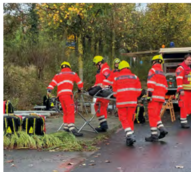
Üben für den Ernstfall: Einsatzkräfte in Mettmann.