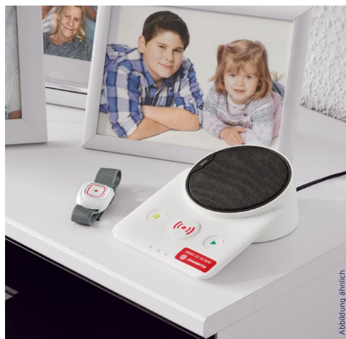
Die Basisstation wird an einem zentralen Ort aufgestellt.

Der Hausnotruf der Johanniter-Unfall-Hilfe schafft Sicherheit in vertrauter Umgebung, wenn Partner, Familie oder Nachbarn nicht zur Stelle sein können. Seit mehr als 35 Jahren bieten die Johanniter zuverlässige Hilfe auf Knopfdruck. Dadurch ermöglichen wir vielen Menschen auch im höheren Alter ein selbstbestimmtes Leben und das Wissen, dass Hilfe kommt, wenn sie benötigt wird.