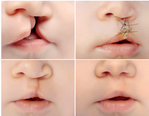
Operativer Verschluss einer einseitigen Lippenspalte

Es ist faszinierend zu sehen, wie schnell einem betroffenen Kind durch eine Operation ein ganz normales Gesicht geschenkt wird. Der erste Anblick nach der OP ist immer sehr berührend für alle Beteiligten.