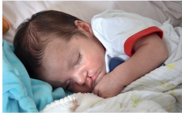
Baby mit Lippen-, Kiefer-, Gaumenspalte