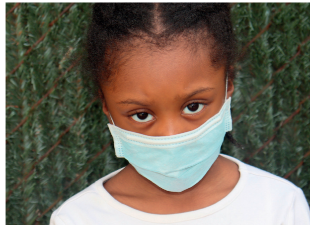
Aus Scham noch mit Maske

Ihre Spende ist auch eine verlässliche Hilfe für besonders betroffene Kinder aus den Entwicklungsländern der dritten Welt, die bei uns regelmäßig eine kostenfreie Behandlung erfahren, von Hilfsorganisationen extra eingeflogen und während ihres Aufenthaltes in Pflegefamilien betreut werden.