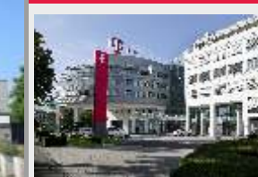
Veranstaltungsort Deutsche Telekom AG

Präsenzveranstaltung Deutsche Telekom AG ohne Livestream