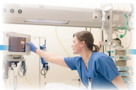
Fachweiterbildung Intensivpflege und Anästhesie