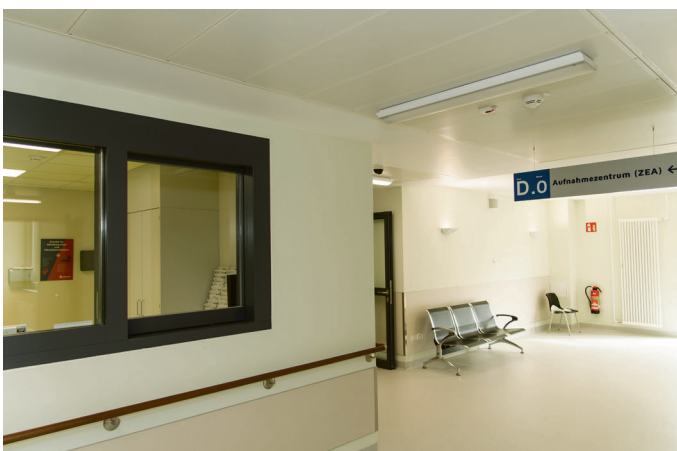
Blick in einen der Flure und Wartebereiche von Haus D (Foto links) sowie in einen der neuen Kreißsäle.