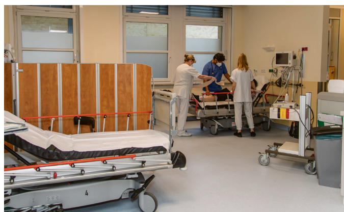
Blick in die neu eingerichtete Beobachtungseinheit in der Notaufnahme.