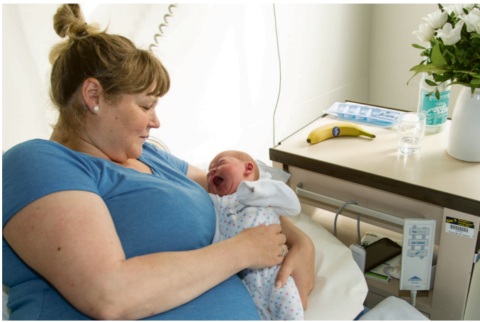
Mutter und Kind sind im Mutter-Kind-Zentrum bestens aufgehoben.