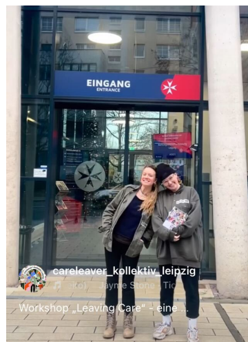
Workshopteam bei der Johanniter Akademie