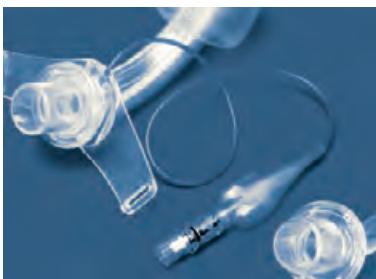
Tracheakanülen als Kombination von Beatmungs- und Dauerkanüle sind mit einem Cuff versehen und haben mindestens eine Innenkanüle. Bei Bedarf eine Sprechventilausstattung.

Die wichtigsten Schritte von der Kontaktaufnahme mit dem Patienten bis zur ambulanten Versorgung können wie folgt beschrieben werden: