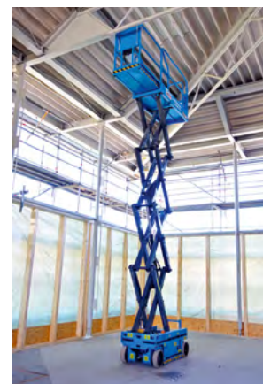
Arbeiten in der Höhe: Auch die Decke wird modernisiert.