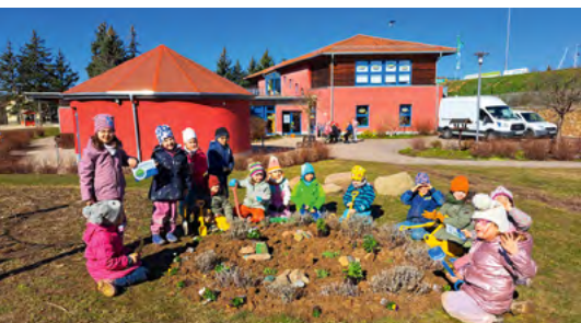
In der Kita Spatzennest wurde ein ganzes Beet von den Kindern der Einrichtung gestaltet.

Was Demenz bedeutet, lernten die Kinder über eine kleine Geschichte: Ein Junge namens Felix erlebt, wie sich sein Großvater verändert und die Krankheit seinen Alltag beeinflusst. Das Beeindruckende: Viele Kinder haben schon klare Vorstellungen,