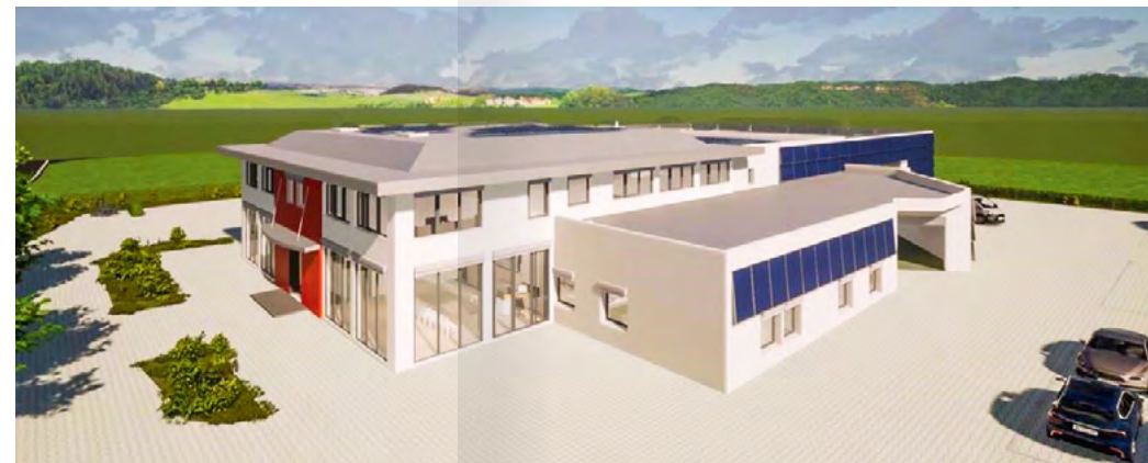
Visualisierung des Architekturbüros Zipp-Röschl: So soll das Akkon einmal aussehen.

Mit dem Akkon Aue stärken die Johanniter nachhaltig die regionale Infrastruktur. Die moderne, resiliente und energieeffiziente Einrichtung stellt sicher, dass im westlichen Erzgebirge auch in potentiellen Krisenzeiten eine verlässliche Versorgung gewährleistet ist.