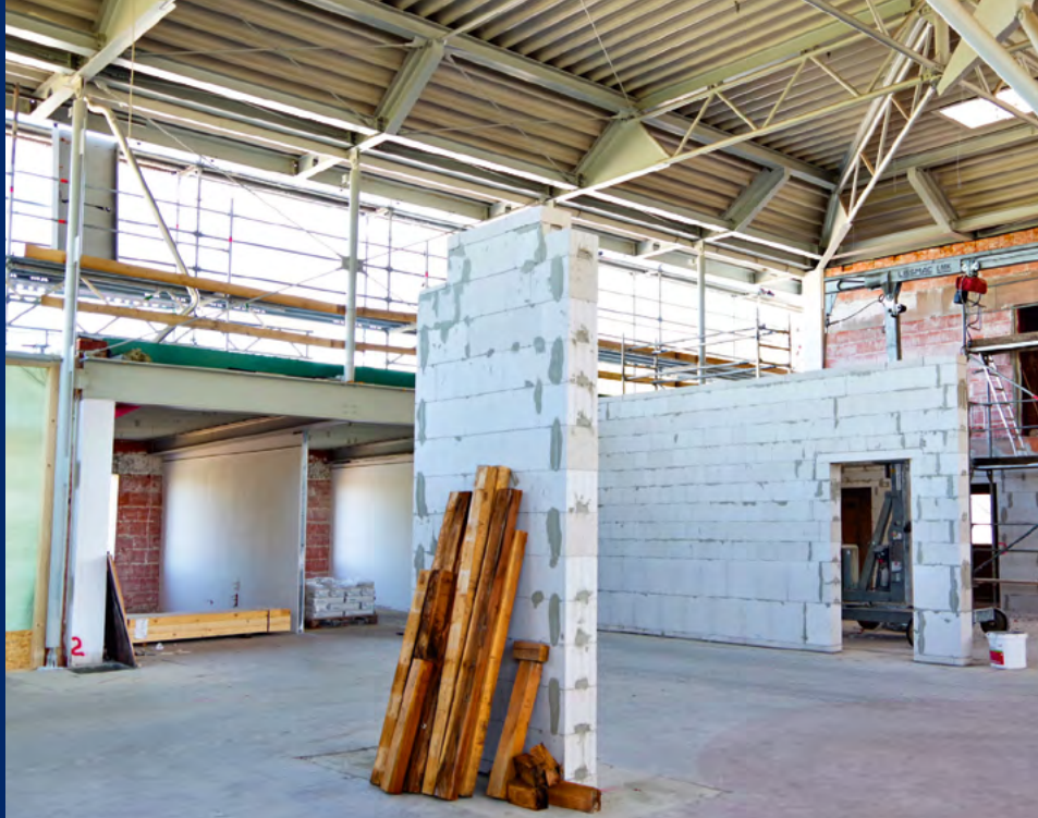
Noch ist jede Menge zu tun im alten Autohaus. Erste Wände des zukünftigen Innenausbaus sind aber schon zu erahnen.