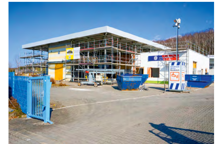
Von Außen zeigt sich der Fortschritt am besten. Auch das Johanniter-Logo ist bereits zu sehen.

Das erste Johanniter-Akkon eröffnete bereits 2019 in Heidenau. Der Regionalverband Dresden erwarb dort ein Autohaus und baute es zum Katastrophenschutzzentrum um. Im Krisenfall können hier bis zu 1.000 Personen komplett autark untergebracht und betreut werden. Der erste Krisentest kam mit der Corona-Pandemie: Das Akkon Heidenau wurde zum Testzentrum umfunktioniert. Im Alltagsbetrieb dient der Standort als Ausbildungs- und Veranstaltungsgebäude, beherbergt einen Pflege- und Fahrdienst sowie den Katastrophenschutzzug des Regionalverbands. Auf einer Freifläche neben