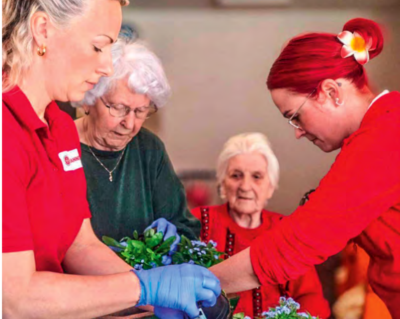
Pflegerinnen und Seniorinnen beim gemeinsamen Pflanzen.