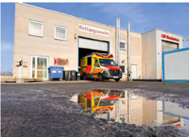
Die Wache im Urzustand: Keine Frage, dass sich der Neubau gelohnt hat.

integrierten Fitnessraum. Auch für getrennte Sanitärbereiche wurde endlich gesorgt.