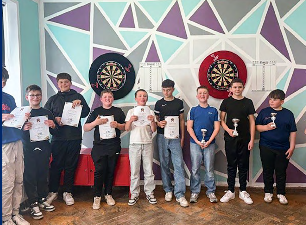
(1) Ferien im Jugendzentrum Gerstungen (2) Jugenddisco URave