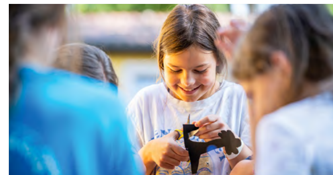
Aus Pappvorlagen bastelten die Kinder filigrane Schattenspiele.

Das Sommerlager findet jährlich statt und wird von der Johanniter-Unfall-Hilfe e.V. und aus Haushaltsmitteln des Landes Sachsen finanziert. Dank der Unterstützung des Johanniterordens konnten auch in diesem Jahr wieder drei Kinder aus Familien mit geringem Einkommen teilnehmen.