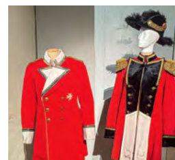
Das Achtspitz in Weiß zierte bereits frühere Gewänder.

Die sächsische Genossenschaft des Johanniterordens, die sächsischen Ordenswerke sowie der Landesverband Sachsen der Johanniter-Unfall-Hilfe e.V. unterstützen die Ausstellung. Ein großer Dank gilt dem Team der Städtischen Museen Zittau für die gelungene Zusammenarbeit.