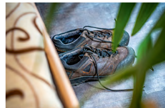
Die Hospizarbeit ist für viele Menschen ein wichtiges Angebot, um mit ihrer Angst nicht allein zu sein.

„Manchmal dauert eine Begleitung nur wenige Tage. Auch die Anfragen sind oft sehr kurzfristig“, so Zingel. „Oft entscheiden die ersten Sekunden, ob ich einen Menschen begleiten kann“, erklärt er. Die Chemie muss stimmen, selbst mit mehr als 10 Jahren Erfahrung. Wichtig sei ihm, ein würdevolles Sterben zu ermöglichen. Der Weg dahin kann bei jedem Menschen ganz unterschiedlich aussehen.