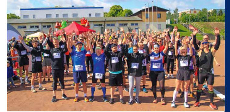
Erfolgreicher Auftakt: Der 1. Beneflitz im Erzgebirge durfte sich über zahlreiche Läuferinnen und Läufer und viele Spenden freuen.

Sachsen / Zwischen April und Juni fanden vier Beneflitz-Spendenläufe in Sachsen statt. Neben Dresden, Leipzig und Zwickau wurde 2025 auch erstmals in Zwönitz für den guten Zweck gelaufen.