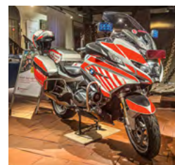
Auch moderne Fahrzeuge zeigt die Ausstellung.

Wie vielfältig das Wirken der Johanniter in der Region noch 750 Jahren später ist, zeigte ein buntes Rahmenprogramm des Kreisverbandes Görlitz. Dabei wurden unter anderem Erste-Hilfe-Kurse angeboten, Infoabende für pflegende Angehörige veranstaltet und Gesprächsrunden zum Thema Nachbarschaftshilfe organisiert.