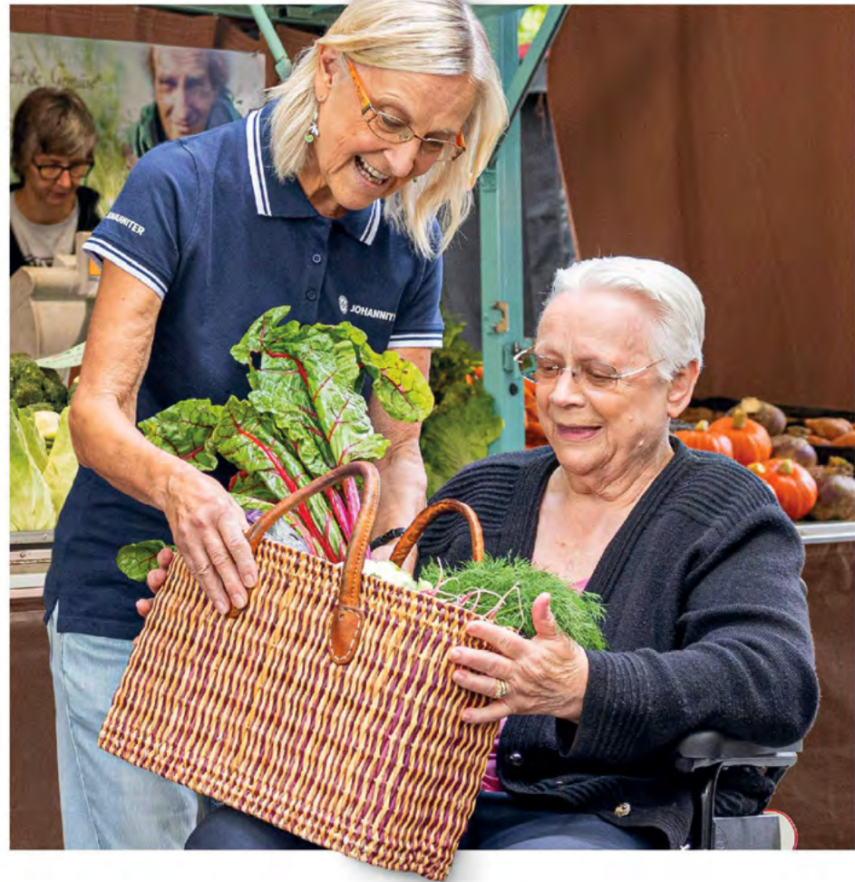
Dein Ehrenamt: Begleiten und Betreuen