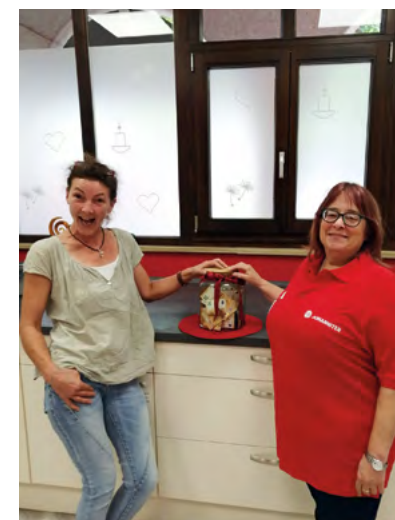
Große Freude bei der Übergabe der Spende an das Trauerzentrum „Lacrima“

www.johanniter.de/mittelfranken/spenden/anlass-spenden