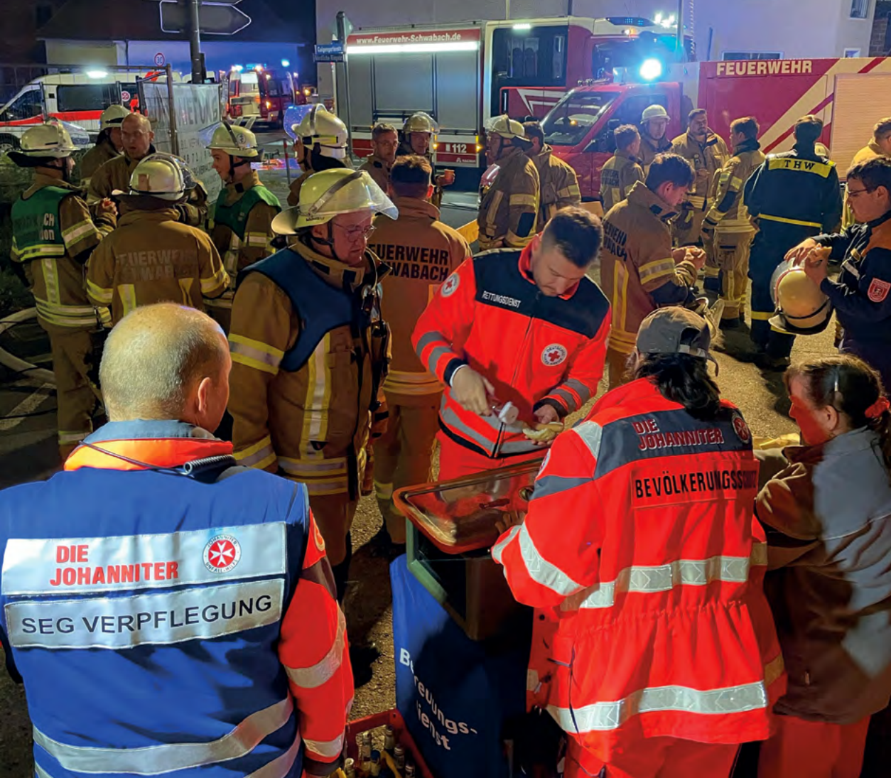
Häuserbrand in Wolkersdorf bei Schwabach – unsere Ehrenamtlichen stehen bereit.